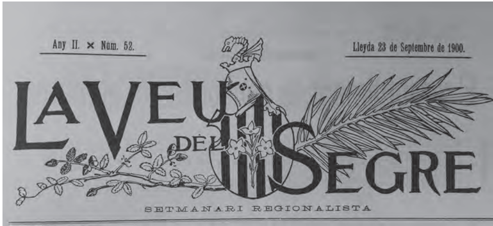
Figura 5: Capçalera de La Veu del Segre.