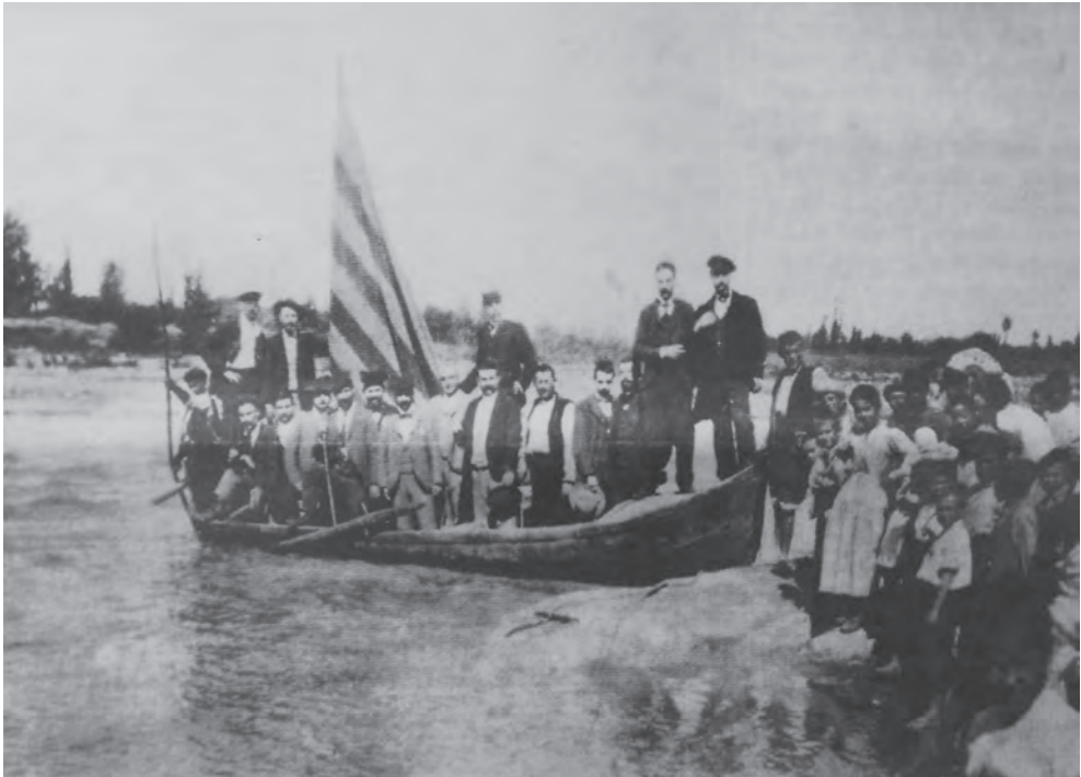
Figura 4: Baixada en barca el 1900.

que el catalanisme a ponent encara no tenia una significació política i es limitava a l'esfera cultural. L'acte va finalitzar amb alguns dels concurrents cantant Els Segadors , cosa que va indignar la parella de la benemèrita enviada a l'acte per Martos perquè vetllés perquè no es cantés l'himne.